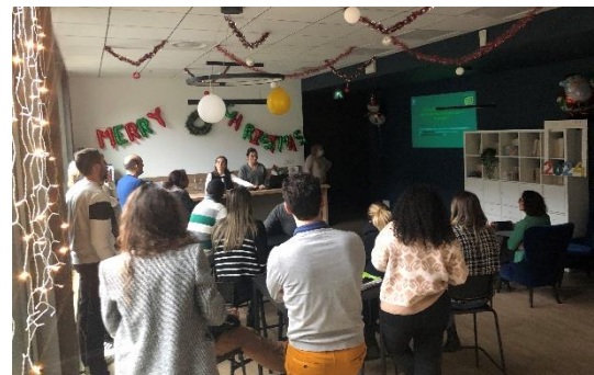
Journée de sensibilisation à la Dysphagie