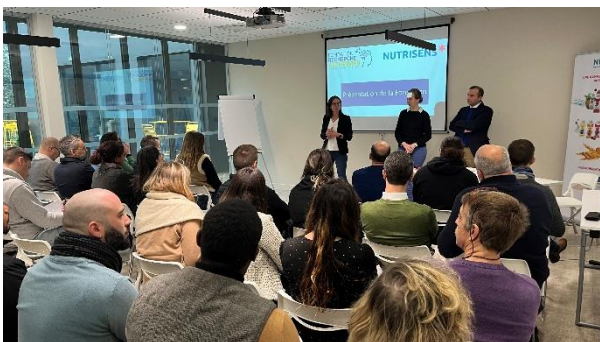
Journée de sensibilisation à la maladie d'Alzheimer

Nous nous engageons également à former et informer l'ensemble de nos collaborateurs à l'univers de Nutrisens via la mise en place d'évènements internes :