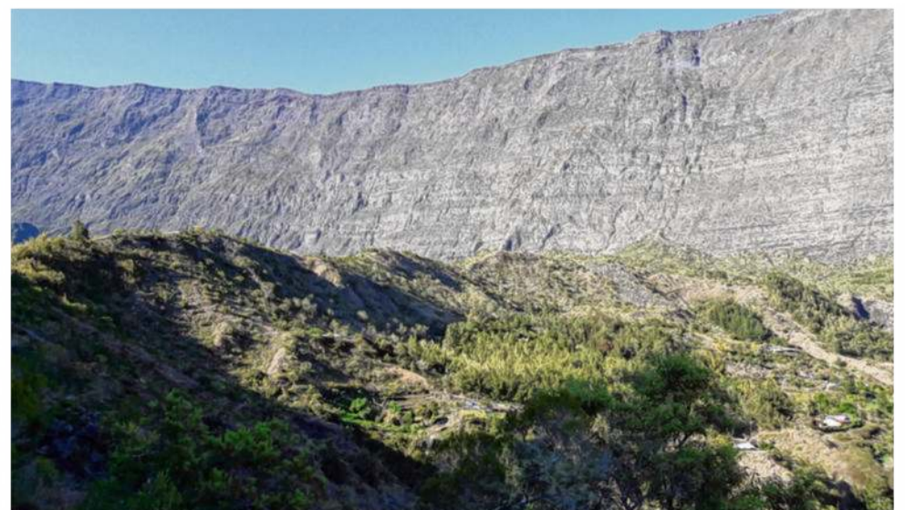
La Réunion constitue un terrain de jeu fabuleux pour les sports extrêmes comme le trail